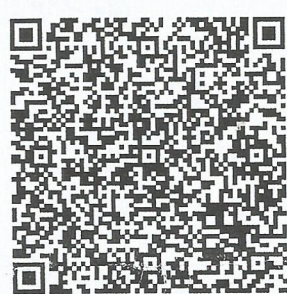
Invoice by square