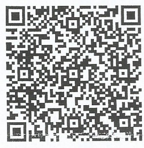
Pay by square